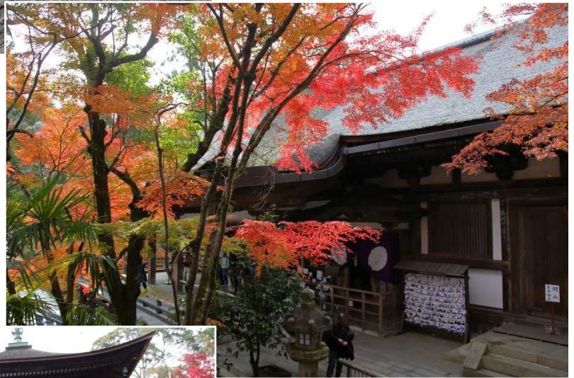
本堂。紋幕の部分が紫式部源氏の間→