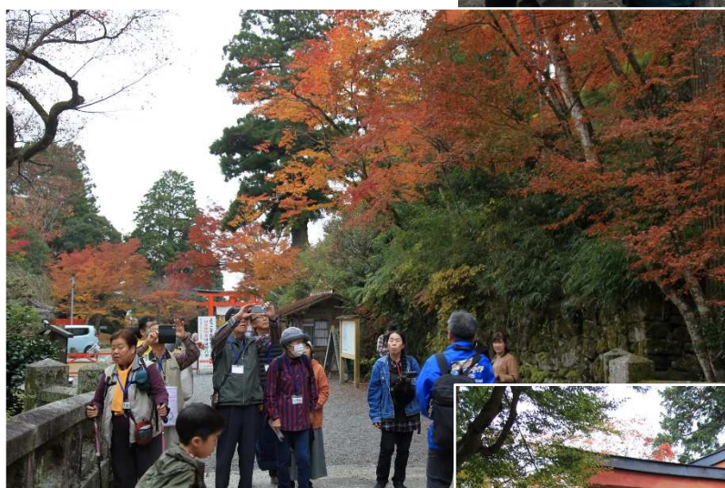
←映画撮影などにも多く使われる 石造の大宮橋