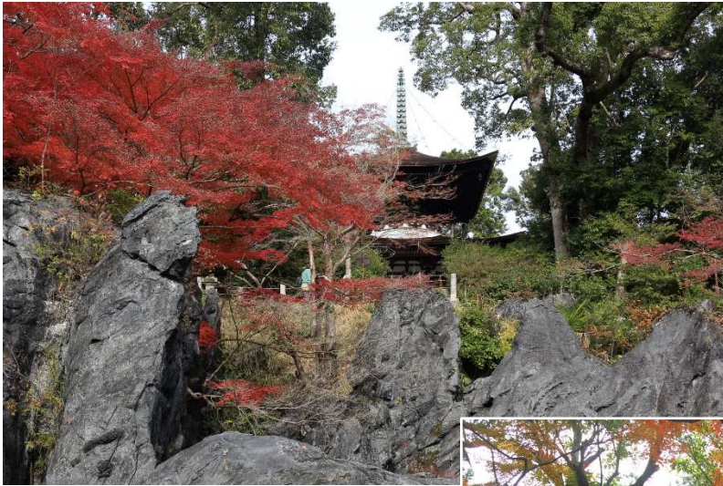
←パワースポット珪灰岩と多宝塔