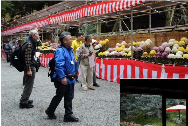
←日吉大社東本宮前の菊花展