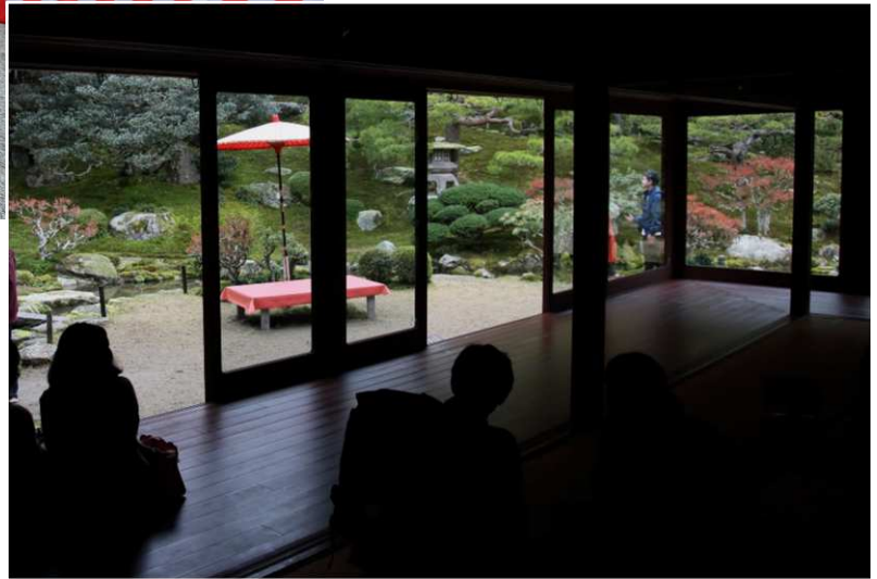
旧竹林院 館内から