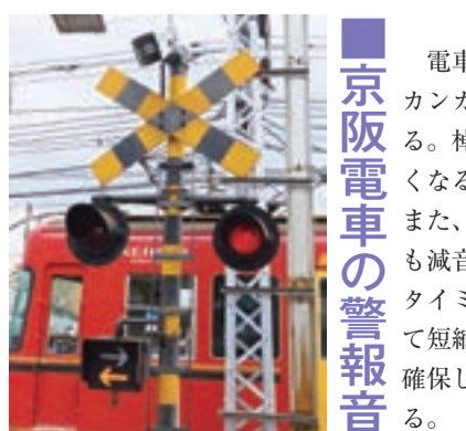
京阪電車の警報音

別所駅から徒歩約5分の湖畔に、びわこ競艇場がある。年間を通じてレースが行われていて、そのエンジン音はかなり離れたところからも聞こえる。大津市民なら一度は聞いたことがあるだろう。湖面を取り込み、昭和27(1952)年にできた。全国で2番目の公認コースで、唯一県が主催。場内スタンドから見晴らし抜群だ。