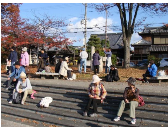
瀬田川岸で小休憩