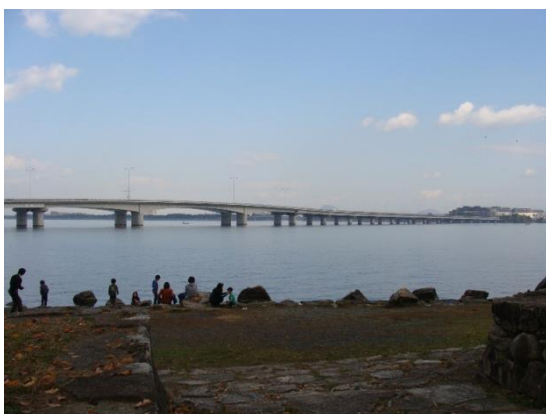
膳所城跡公園で昼食