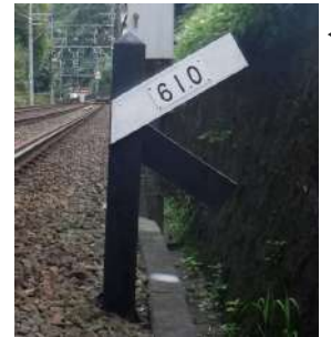
◀ 61%の勾配標

大津線の最急勾配は京津線大谷駅～上柴町駅にある61.0%で、これは京阪電車全線(ケーブル線除く)の中でも1位になります。石山坂本線の最急勾配は松ノ馬場駅～坂本比叡山口駅にある40.0%です。勾配標は京津線ではびわ湖浜大津駅に向かって左側、石山坂本線では坂本比叡山口駅に向かって左側の線路脇に置かれています。運転席の後ろから勾配標を見て線路の変化を知るのも面白いですよ。