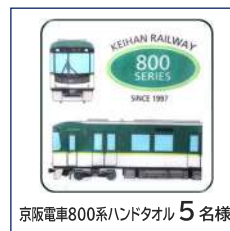
京阪電車800系ハンドタオル 5名様

頂いた疑問やご意見に対して回答をお約束するものではありません。当選者の発表は賞品の発送をもってかえさせていただきます。プレゼントは選べません。