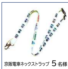
京阪電車ネックストラップ 5名様